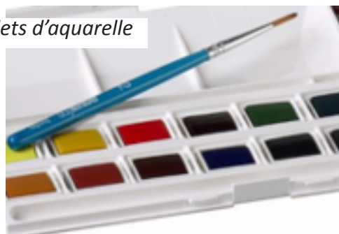
Boîte plastique de 12 1/2 godets d'aquarelle